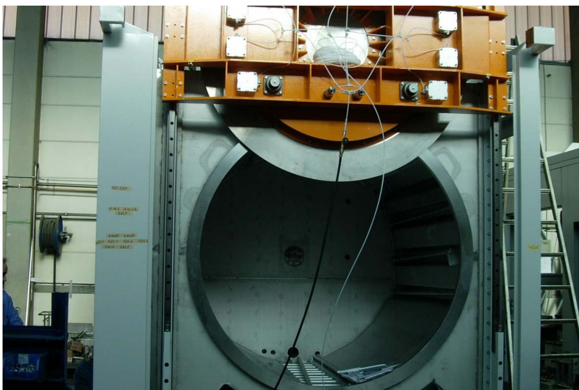
VUE CHAMBRE DE TRAVAIL PORTE OUVERTE