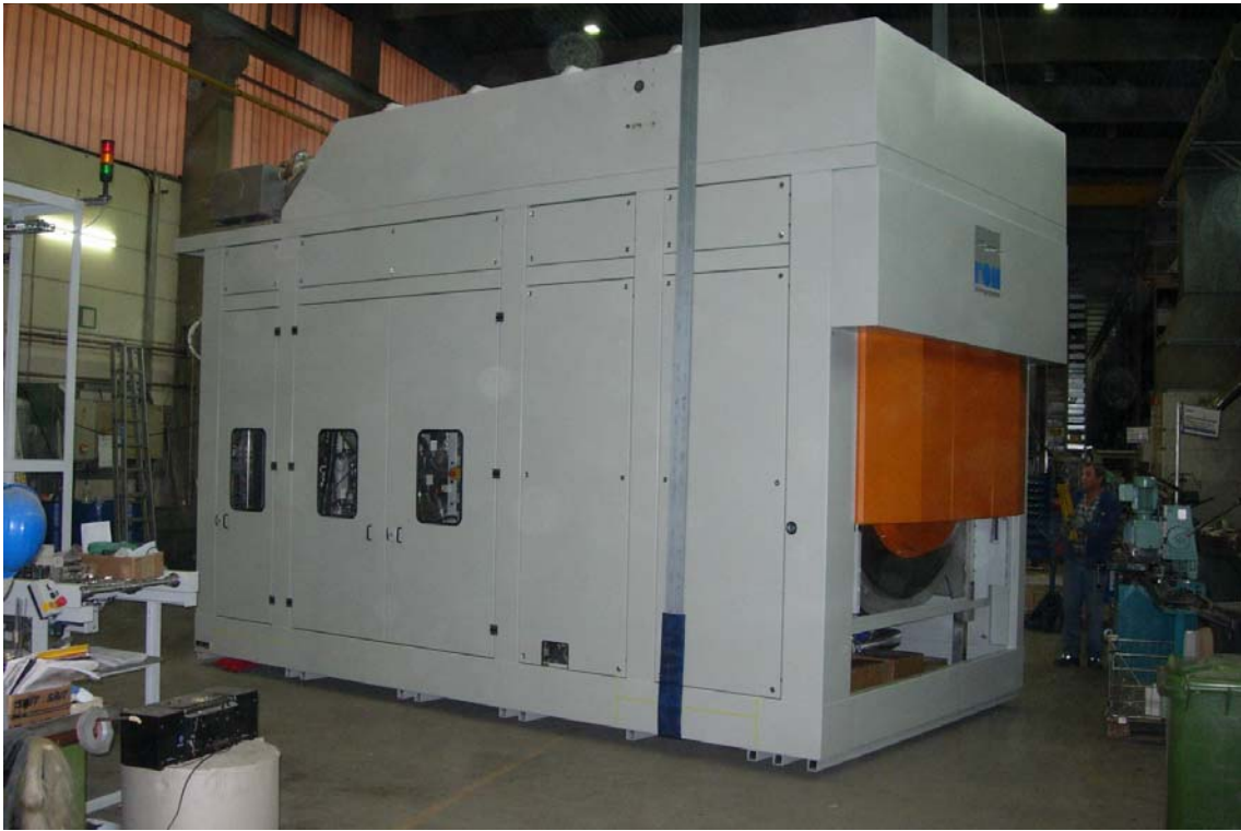
MACHINE RWVTS 170 124 097 A CHASSIS FIXE AVEC IMMERSION ET VAPEUR